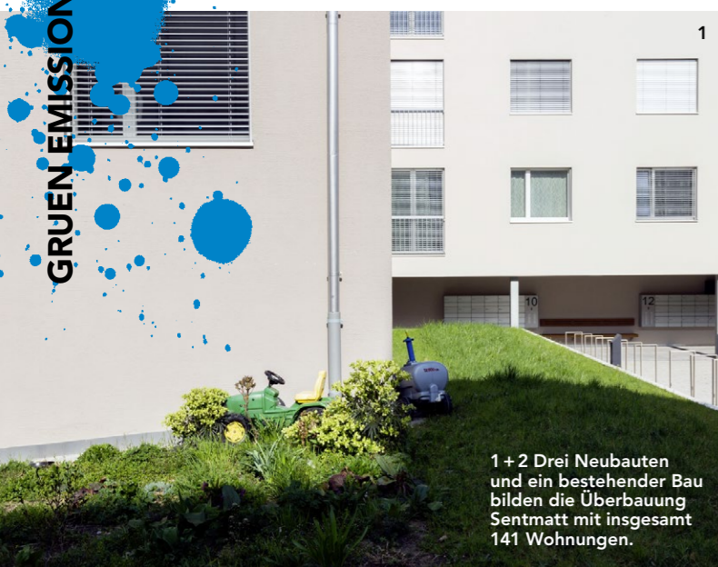
1 + 2 Drei Neubauten und ein bestehender Bau bilden die Überbauung Sentmatt mit insgesamt 141 Wohnungen.